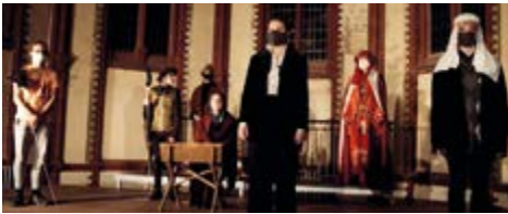
"Keiner da" – Das Krippenspiel der Jugendlichen, diesmal mit Maske und ausschließlich online zu sehen