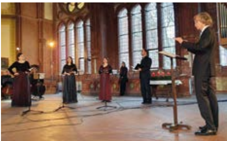
Videoaufnahmen der Weihnachtsmusik des Sächsischen Barockorckesters unter der Leitung von Gotthold Schwarz