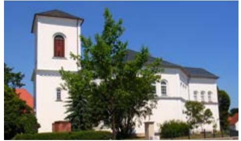
Die Hoffnungskirche in Knauthain

Das Zentrum des Knauthainer Gemeindelebens bildet die Hoffnungskirche und das dazugehörige 2017 neu errichtete Gemeindehaus. Wir sind eine junge, lebendige Gemeinde mit vielen Kreisen von klein bis groß, bzw. jung bis alt. Vieles wird seit vielen Jahren schon lange im Ehrenamt bewältigt, weil es uns wichtig ist, dass das Gemeindeleben bunt, fröhlich, authentisch und abwechslungsreich, den Menschen zugewandt und im Vertrauen auf Gott gelebt wird.