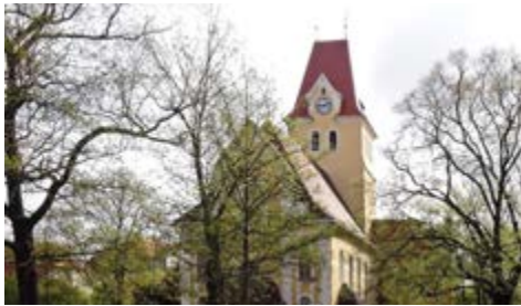
Die Apostelkirche in Großzschocher

Ich heiße Apostelkirchgemeinde Großzschocher-Windorf, bin 802 Jahre alt und habe ca. 800 Familienmitglieder. Sie finden unsere Kirche mit Gemeindehaus am zentralen Platz in Großzschocher. Hier feiern wir unser Kirchplatzfest und treffen uns zu Arbeitseinsätzen oder nach dem Gottesdienst. Hier lernen sich Menschen kennen und nehmen voneinander Abschied. Wir sind eine offene Gemeinde, die fest zum Bild des Stadtteils gehört und die Menschen zu sich einlädt.