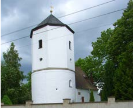
Die Andreaskapelle in Knautnaundorf

Die alte Dorfkirche in Rehbach mitten auf dem Anger ist für viele weit sichtbar, wenn man über die A 38 Richtung Leipzig fährt. In ihr lauschen wir gern Sommermusiken, treffen uns für Segnungsfeiern von Paaren oder erleben Krippenspiele von den unterschiedlichsten Gruppen, wie Jugendliche und Erwachsene.