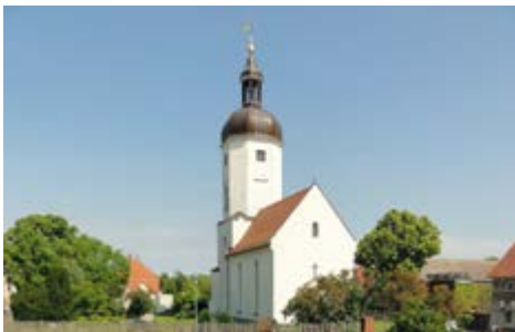
Die Dorfkirche in Rehbach

Die alte Dorfkirche in Rehbach mitten auf dem Anger ist für viele weit sichtbar, wenn man über die A 38 Richtung Leipzig fährt. In ihr lauschen wir gern Sommermusiken, treffen uns für Segnungsfeiern von Paaren oder erleben Krippenspiele von den unterschiedlichsten Gruppen, wie Jugendliche und Erwachsene.