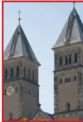
15:30 Uhr Taborkirche (Kleinzschocher - Windorfer Straße 45)