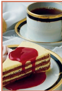
16:00 Uhr Kaffee, Kuchen, Obst