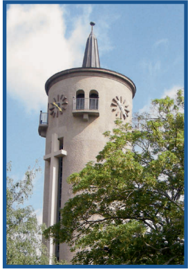
9:30 Uhr Bethanienkirche (Schleußig - Stieglitzstraße 42)