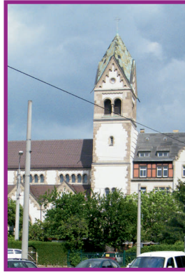
13:30 Liebfrauenkirche (Lindenau - Karl-Heine-Straße 110)