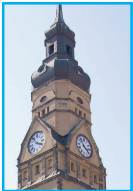
12:05 Uhr Philippuskirche (Lindenau - Aurelienstraße 54)